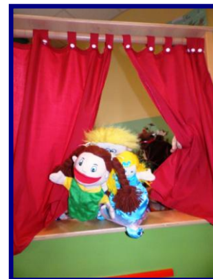
Teatrzyk lalek w krótkiej prezentacji